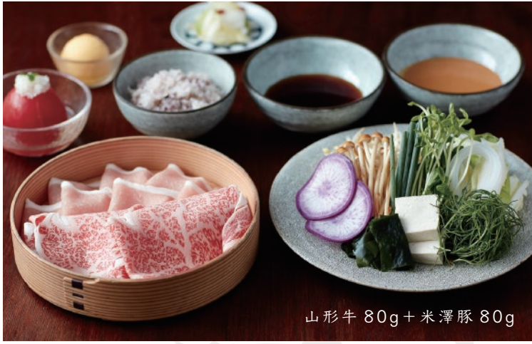
山形牛 80g + 米澤豚 80g

牛肉はA4ランク以上の良質な黒毛和牛のリブロースを三種類ご用意しております。お好きなお肉をお選びください。豚肉はすべて「米澤豚一番育ち」を使用しております。