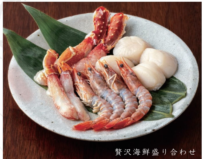
贅沢海鮮盛り合わせ