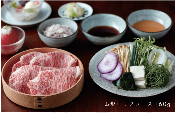
山形牛リブローズ 160g

牛肉はA4ランク以上の良質な黒毛和牛を 三種類ご用意しております。お好きなお肉をお選びください。